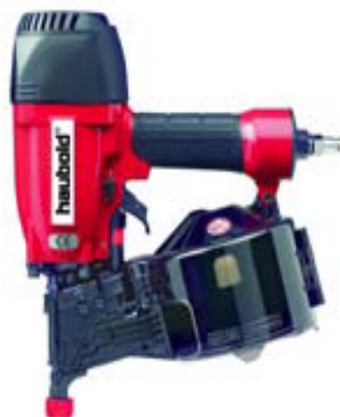
Haubold RNC 50M, RNC 65 S/WII