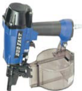
Duo Fast CNP 50.1, CNP 65.1,